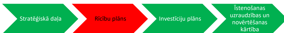
1.att. Attīstības programmas galvenās sastāvdaļas

Ķekavas novada attīstības programma 2021.- 2027.gadam ir vidēja termiņa plānošanas dokuments, kurā noteikts attīstības redzējums līdz 2027. gadam.